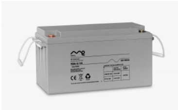
Batería monobloc me 12/150