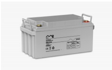
Batería monobloc me 12/80