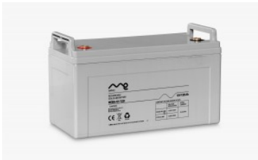
Batería monobloc me 12/120